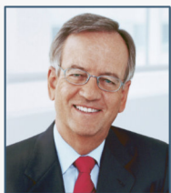
Prof. Dr. Heinrich von Pierer

um auch in Krisenzeiten wieder etwas ruhiger zu schlafen: EIM und unsere Manager profitieren zusätzlich von dem Erfahrungsschatz dieser Business Leader mit Restrukturierungsexpertise, um schnell die notwendige Lösung für Ihr Unternehmen zu finden.