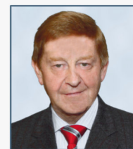
Dr. Otto Wiesheu

Ehem. Vorstandsmitglied Karstadt AG, Bertelsmann AG & Vorstandsvorsitzender Thiel Logistik AG; Unternehmensberater und Aufsichtsrat/Beirat