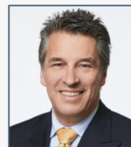
Alf Henryk Wulf

Ehem. Vorstandsmitglied Nutzfahrzeuge weltweit der Daimler AG und Präsident der Automobilverbände OICA und VDA